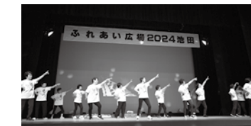
▲令和6年度ふれあい広場の様子。各種福祉団体の活動や事業などに共同募金の一部が活用されています。